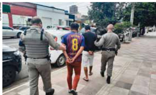
Ambos com 24 anos, os dois rapazes detidos ontem à tarde já tinham antecedentes